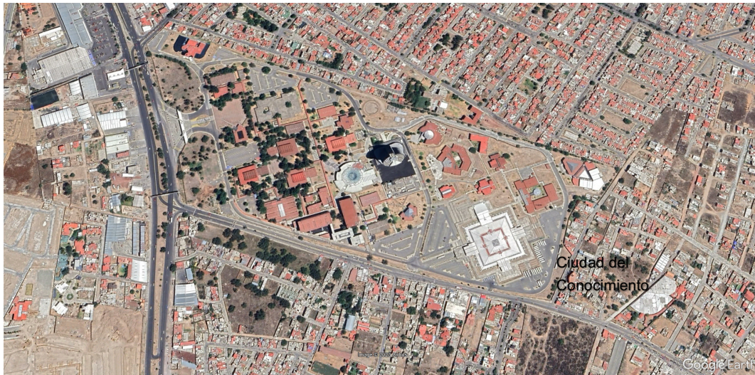
Fig. 1. Ubicación de Ciudad del Conocimiento en la zona metropolitana de la ciudad de Mineral de la Reforma, donde se ubica el Instituto de Ciencias Básicas e Ingeniería.

SEDE: Universidad Autónoma del Estado de Hidalgo Instituto de Ciencias Básicas e Ingeniería Ciudad del Conocimiento Km 4. 5 de la carretera a Tulancingo-Pachuca s/n Colonia Carboneras Mineral de la Reforma C.P. 42186 (Fig. 1)